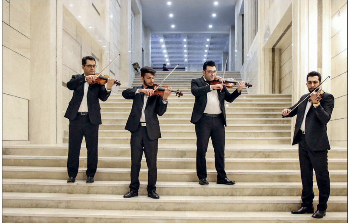
کنسرت ارکستر فلار مونیخ تبریز