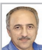
مر تفضی افقه

کالابرگ الکترونیک که در قانون بودجه ۱۴۰۱ نیز پیش‌بینی شده، قرار است حداکثر از نیمه دوم سال جایگزین یارانه نقدی شود. کالابرگ تنها برای بخشی از کالاهای خوراکی (احتمالاً همان چهار قلمی که هدف آردسازی در دیهشت ماه قرار گرفتند به اضافه نان و چند کالای دیگر) در نظر گرفته می‌شود اما برای موفقیت در این سیاست، دو مسأله مهم وجود دارد که باید به آن توجه کرد؛ اول اینکه دایره شمول کالابرگ گسترده باشد و تنها کالاهایی که مستقیماً آردسازی شدند را در برنگیرد بلکه کالاهای رده دوم و آنهایی که نرخ‌شان متناز از کالاهای آردسازی شده است، باید شامل کالابرگ شوند. دوم اینکه کالابرگ به تنهایی کافی نیست؛ چرا که موج تورمی در دیهشت‌ها که در خرداد تثبیت و نمایان شد، تنها محدود به اقلام خوراکی نبوده؛ حذف ارز تر جیحی خوراکی‌ها، تمام کالاهای خدمات مورد نیاز مردم را گران کرده است؛ نباید فراموش کنند که مردم به خصوص کارگران، بازنشستگان و زنان سرپرست خانوار، نیاز به سرپناهی برای زیستن دارند؛ نیاز به دارو برای درمان و آموزش و حمل و نقل دارند... ادامه در صفحه ۸