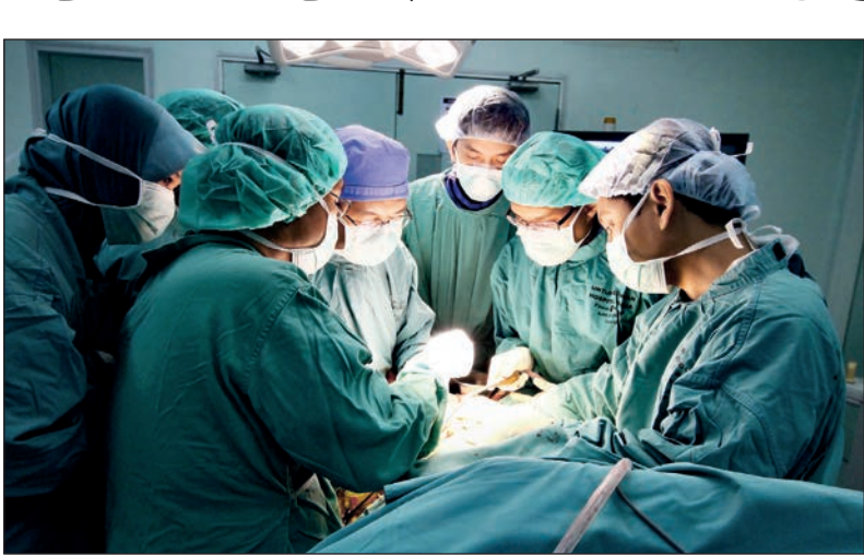
تیم جراحی در بیمارستان امام خمینی تهران

ماجرا از یک کلیپ کوتاه شروع شد که در آن پدر جوانی مدعی بود نوزادشان به دلیل قصور پزشک آنکالی که بر سر بالین همسرش حاضر نشده، فلج شده است؛ هر چند این موضوع همچنان در دست بررسی است، اما این پرسش را ایجاد می‌کند که آنکالی پزشکان چه‌قاعده قانونی دارد و پزشک آنکال طی چه مدت و در شرایطی باید بر بالین بیمار حاضر شود؟