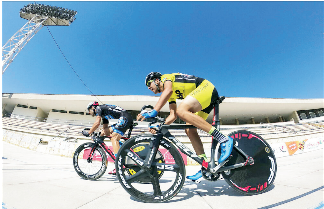
رقابت‌های لیگ برتر دوچرخه سواری. مجموعه ورزشی آزادی