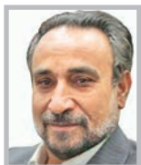
محمد رضا خباز

نخست و واقعیت عربان جامعه امروز ایرانی آن است که مردم با مشکلات اقتصادی و معیشتی فراوانی دست‌به‌گریبان هستند. در این شرایط، یکی از مراجع گرانقدر شیعه در اظهار نظری عادی نسبت به مشکلات معیشتی مردم، گلایه و در ادامه نیز اشاره کرده‌اند که ایران باید با تمام کشورهای جهان ارتباط مناسبی برقرار کند. همچنین تأکید داشتند در دست نیست که مناسبات ارتباطی ایران با جهان پیرامونی همواره با چالش همراه باشد. اما بلافاصله پس از این اظهار نظر منطقی برخی افراد و جریان‌ها افراطی و تند نسبت به موضوعات مختلف دارند، شروع به انتقاد از این اظهار نظر آیت‌الله صافی گلپایگانی کردند. بعد از این اتفاق تاسف‌آور و دردناک، همه افرادی که دل در گروی اسلام و آزادی بیان دارند، نسبت به این حادثه واکنش نشان دادند و خواستار برخورد با یک چنین رفتارهای دون شأن انسانی شدند. متأسفانه یکی از عادت‌ها و اخلاق‌های ناپسندی که در سال‌های بعد از انقلاب در کشور مرسوم شده، گسترش اهانت‌ها و تخریب‌ها بدون توجه به جایگاه‌های افراد است.