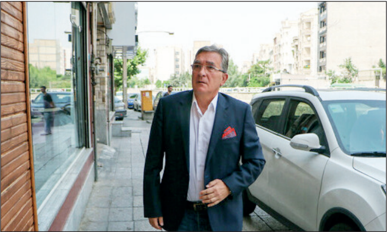
جریان است. با این شرایط حالا اگر قرار باشد میان باشگاه پرسپولیس و برانکو یونانکوویچ توافقی حاصل شود قاعدتا سابق شان هزینه دادرسی فیفا را نیز به و پرداخت کنند.