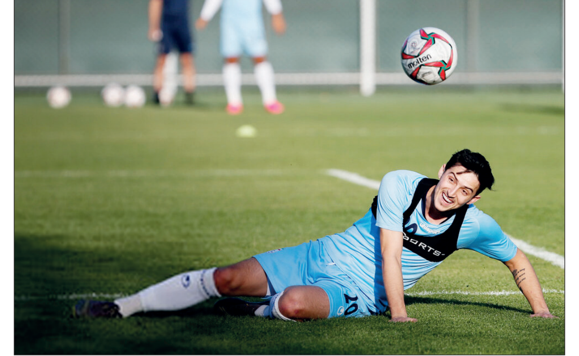
تمرین تیم ملی فوتبال برای آمادگی جهت بازی با تیم‌های ملی کامبوج و بحرین