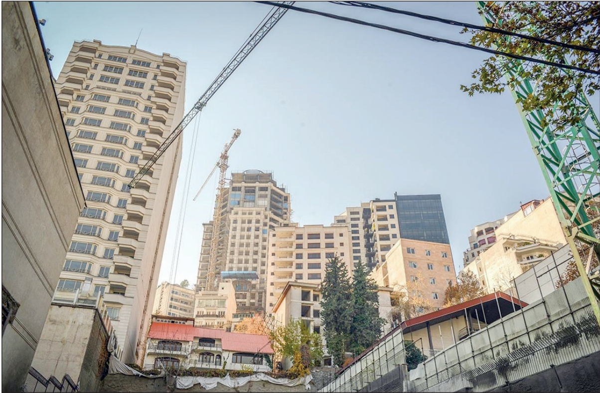
ستاریان: پرداخت وام مسکن فقط ۴ تا ۵ درصد از مشکلات مسکن را در ایران حل می کند بنابراین در صورت افزایش سقف تسهیلات هم نمی توان به رونق و بهبود بازار مسکن در کشورمان دل بست

این استاد دانشگاه با اشاره به تجربه سایر کشورها در پرداخت تسهیلات توسط متقاضیان می‌گوید: در کشورهای دیگر، وام خرید سهم بالایی از هزینه مسکن