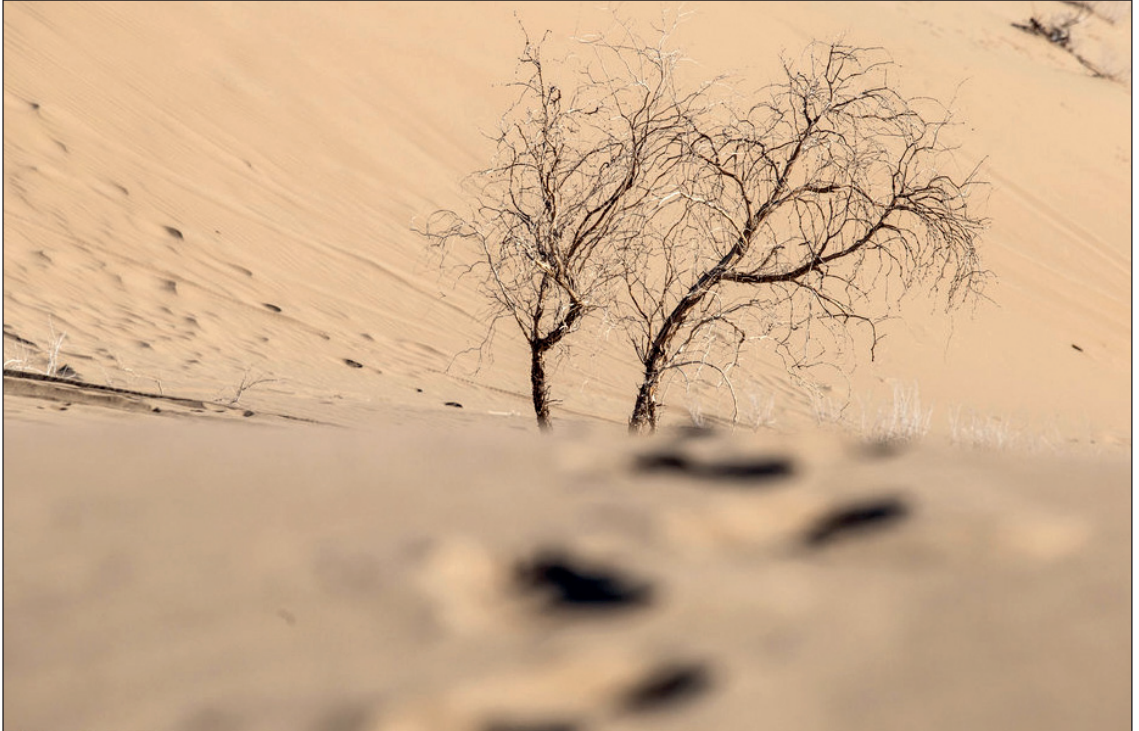
کوبز بیای «ابوزید آباد»/شمال شرقی کاشان