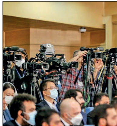
روزنامه «تعادل» در کنفرانس مطبوعاتی رئیس‌جمهور دعوت نبود

همسایگان آغاز کردیم و سیاست همسایگی را پیگیری کردیم. ریسی یادآور شد: من اولین سفرم در دولت به خوزستان بود تا مشکلاتی که مردم آنجا در مساله آب داشتند را بررسی کنیم و آب‌رسانی به خوزستان امروز در حال اجرا است و برنامه‌های بلندمدت، میان مدت و کوتاه مدت را داریم و دولت تأکید داریم که در زمینه مصرف آب برنامه‌ریزی و مدیریت داشته باشیم. همچنین تنش‌های آبی در استان‌های مختلف شناسایی شده است و برای آن برنامه‌ریزی کرده‌ایم. ریسی جمهوری در ادامه با بیان اینکه مساله حقوق دستمزد از موضوعات مهم دولت است، گفت: در زمانی که دولت را تحویل گرفتیم برای پرداخت حقوق کارمندان با مشکلاتی مواجه بودیم، اما امروز یک روز پرداخت حقوق و دستمزد عقب نیفتاده، آن هم بدون اینکه استعراض و چاب پول داشته باشیم. چرا که در آمد ایجاد شد، فروش نفت صورت گرفت و فرارهای مالیاتی را پیگیری کردیم و نتیجه این شد که هم حقوق پرداخت شد و هم بدهی دولت گذشته را پرداخت کردیم. در کنار حقوق و دستمزد، سرسیدهای اوراقی که قبل وجود دارد می‌سد و باید پرداخت شود. وی افزود: ۲۰۲ هزار میلیارد تومان مجموعه کار مادر حوزه عمرانی است و این امر با افزایش درآمد رخ داده است. این در حالی است که ما یک چیز را نداریم و آن این است که ما آن ۲۰ درصد درآمد از صندوق توسعه ملی را نداریم و ۴۰ درصد از فروش نفت را به صندوق توسعه می‌ریزیم تا در اختیار توسعه کشور باشد در حالی که در گذشته از این ۴۰ درصد، ۲۰ درصد در اختیار دولت قرار داشت.