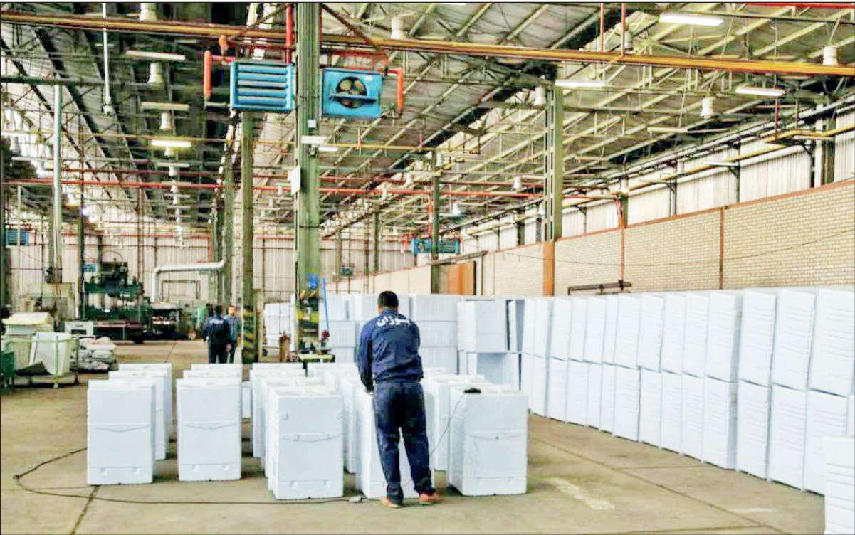
برای حمایت از تولید بانک‌ها باید واحدهای تولیدی تملک‌شده به صاحبان اولیه بازگردانند

■ اشاره شما به تزریق ۴۵ میلیون دلاری ارز به بازار است؛ به نظر تان این تصمیم تصمیم درستی بوده است؟ در کوتاه‌مدت چون قیمت ارز، لنگر اسمی است در اقتصاد ایران، نباید اجازه بدهیم قیمت ارز از یک حدی بالاتر رود؛ من به عنوان یک مسکن این تزریق برای کنترل بازار آزاد اجتناب ناپذیر می‌دانم و باید این تزریق انجام می‌شد، در واقع این تصمیم در ست است؛ اما دقت کنید کل کالاها در حال رشد قیمت است؛ اینکه شما قیمت ارز را به صورت مصنوعی کاهش دهید و مخالف اوراق است و قصد دارد با تداوم هدایت