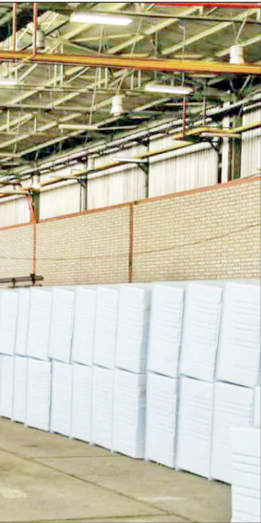
کارشناسان واحدهای تولیدی در یک کارخانه تولیدی

در مجموع می‌توانم بگویم که شرایط از نظر سیاست‌گذاری اقتصادی اصلا مناسب نیست؛ اگر شما می‌بینید که قیمت مسکن ناگهان دوباره سیر تصاعدی گرفته، شاخص بورس در حال بالا رفتن است، قیمت دلار و ارز مدام افزایش پیدا می‌کند، این‌ها نشانه‌های یک موج تازه توری است. توصیه اکید من به مردم و نظام سیاسی این است که تجربیات سایر ملل در زمینه‌های اقتصادی درس بگیریم؛ اقتصادانی که با نظر پانسان این وضعیت امروز را به وجود آورده‌اند باید قدری با ملاحظه بیشتر به نظر انشان توجه شود، نه اینکه این افراد