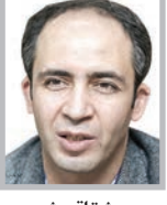
وحید شاققی شهری

جای خالی ابرچالش هادر مناظرات واقع آن است که مناظره دور نخست نامزدهای کسب کرسی ریاست جمهوری ایران با محوریت اقتصاد، اثربخشی و کارآمدی لازم برای به تصویر کشیدن ابرچالش‌های اقتصادی ایران رانداشت. در این دور، هم فرصت نامزدها برای تبیین برنامه‌های‌شان محدود بود و هم اینکه مسیر مناظره به سمت و سویی رفت که امکان هر خورده علمی یا موضوعات مهم را از نامزدها گرفت.