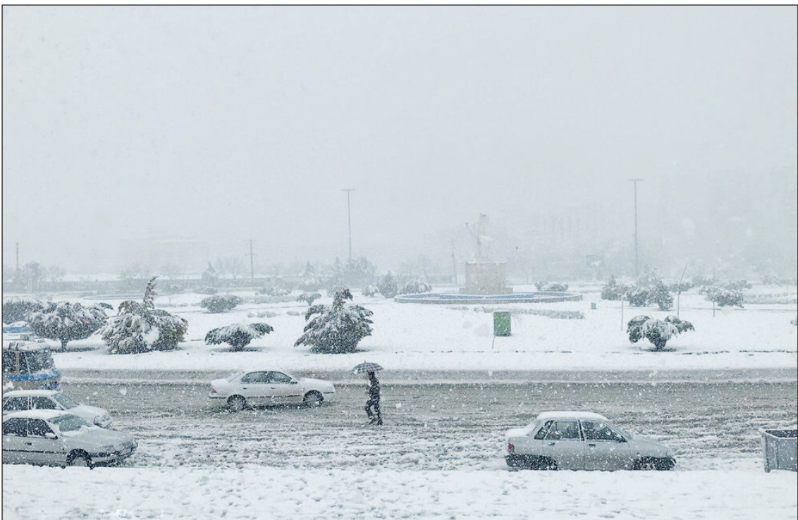
بارش برف در آخرین روزهای زمستان، کرمانشاه را سفیدپوش کرد