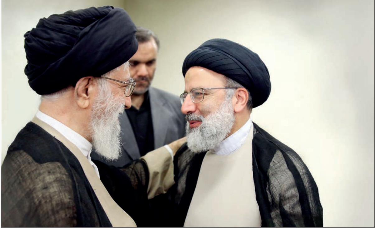
والسلام علیکم‌ورحمه‌الله سیدعلی‌خامنهای ۱۶اسفند۱۳۹۷

قدر دانی کنم و برای توفیق کامل جنابعالی و همکارانتان دست‌دعوا و توسل به‌در کار بونی بلند کنم و توجهات‌دعای حضرت بقیه‌الله را و احفاق‌فاده را امسال تمامیم.