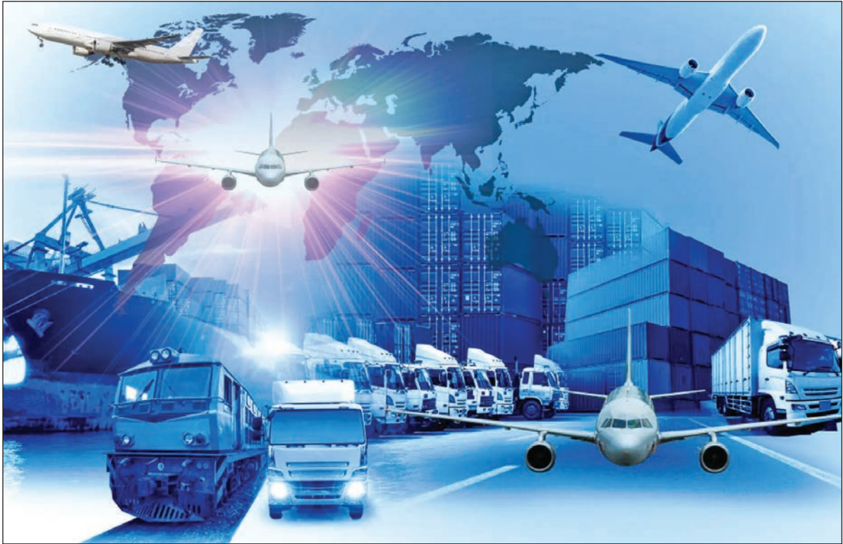
گروه راه و شهرسازی |

به‌فاصله یک‌ماه‌از رونمایی طرح عراق برای اتصال بندر فلو به ترکیه و اروپا، حالا خبر آمده است که هند و روسیه یک مسیر تازه و غیرایرانی را برای مبادله کالا انتخاب کرده‌اند. این همه در حالی است که مسوولان دولتی و سیاسیون جناح‌های کشور سرگرم ارزیابی عضویت دیر هنگام ایران در سازمان همکاری شانگهای هستند. مزیت‌سوزی‌های ترانزیتی ایران اما گوی بیاینی ندارد. طی سال‌های اخیر، چین در فرآیند احیای جاده ابریشم، تلاش کرده است تا ایران را دور بزند و مسیرهای ریلی و جاده‌ای متعددی از شمال ایران به مقصد اروپا طراحی و اجرایی کرده‌است. این در حالی است که اقتصاد ایران، دهه ۱۳۹۰ را به‌طور کلی از دست داده است و رکوردهای بسیار نامطلوبی را در تشکیل سرمایه و استهلاک سرمایه بر جای گذاشته‌است. بی‌گمان، بخشی از پسررفت‌های سرمایه‌گذاری در حوزه حمل و نقل اعم از ریلی، جاده‌ای، هوایی و دریایی صورت گرفته‌است. در یک نمونه، ساخت خط آهن شت‌به‌استرا به‌عنوان حلقه‌مفقوده رک‌یدور شمال-جنوب چندین سال است که معطل سرمایه‌گذاری است و به تا زگی ساخت این مسیر ریلی به روسیه واگذار شد و قرار است تا سه سال آینده ساخته‌شود. هم‌زمان با عدم توسعه زیرساخت‌های ترانزیتی ایران، قوانین دست‌وپاگیر نیز بیش از پیش مزیت ترانزیتی کشور را نشان رفته‌است و شرایط نامید‌کننده‌ای را به وجود آورده‌است.