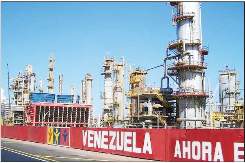
پمپ نفت در نزدیکی ایستگاه پالایش نفت در ونزوئلا

که برای ۹۹ مورد از آنها مجوز ترک تشریفات قانون و مقررات بر گزار می‌گردد. انسان‌ات از طرف معاونت علمی و فناوری ریاست جمهوری صادر شده است. عملیات تولید بار اول معاونت علمی و فناوری ریاست جمهوری از ۳ میلیارد دلار سرمایه‌گذاری شده است و حجم کارهای انجام شده در زمینه تولید بار اول، به بیش از ۳ هزار میلیارد تومان رسیده است. تولید دانش‌بنیان دقیقاً در جایی ورود می‌کند که در زنجیره دانش بنیان شکست رخ می‌دهد؛ زنجیره دانش بنیان با موفقیت در زمینه تولید شکست در تولید و در زنجیره دانش بنیان شده است. و توسعه تجهیزات تولیدی در کشور اقدام کرده است ولی در زمینه تولید بار اول تجهیزات به نوعی دچار شکست در تولید و در زنجیره دانش بنیان شده است. در این صنعت سه خود کفایی و بومی سازی اقلام راهبردی زنجیره ارزش نفت و گاز پیرداد و صنعت نفت و گاز کشور به سمت دانش بنیان شدن حرکت کرده است. موضوع تولید بار اول از سال ۹۷اجرای شده است؛ کار گروه تولید بار اول با مشارکت معاونت علمی و فناوری ریاست جمهوری و وزارت صنعت تشکیل شد تا این مشکل را به کمک حوزه دانش بنیان هارفع کند. بر همین اساس نیز تاکنون و در طول ۳ سال گذشته، ۱۹۲ طرح از بیش از ۷۰ دستگاه دولتی و خصوصی، توسط دبیرخانه کار گروه تولید بار اول دریافت شد