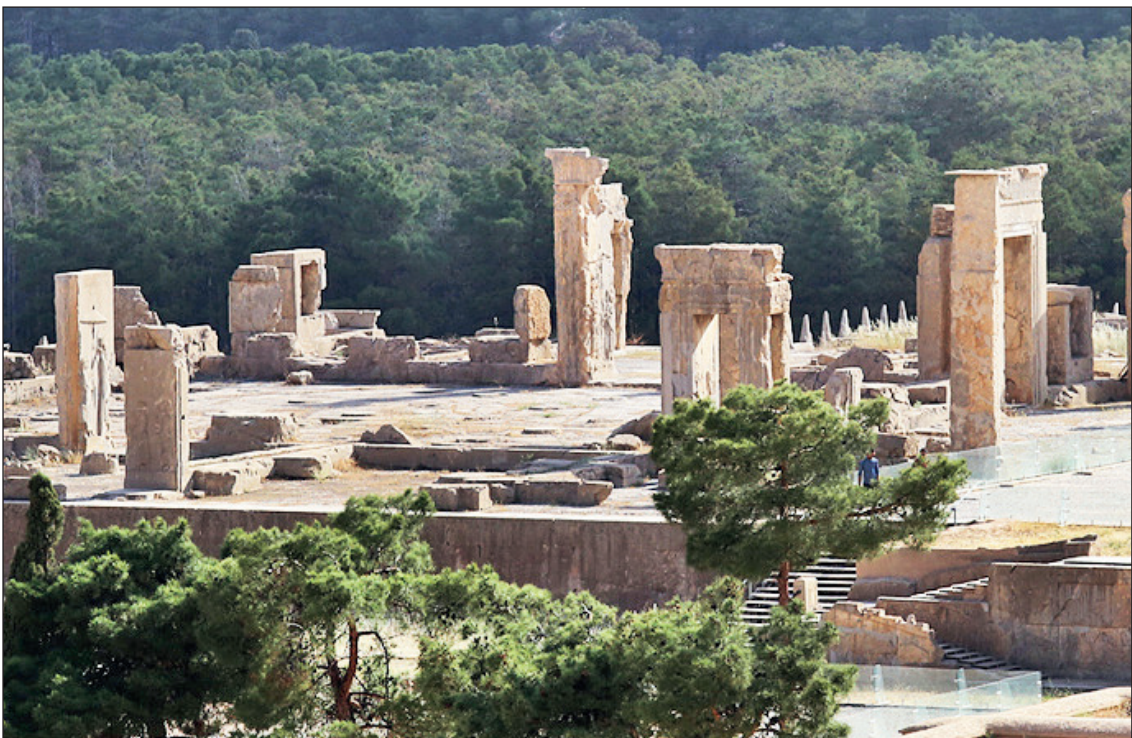
سکوت مطلق در تخت جمشید