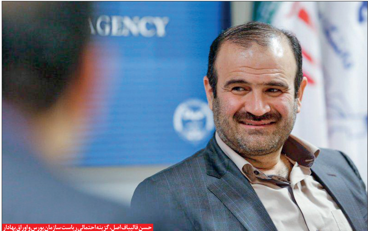
حسن قالیباف اصل، گزینه احتمالی ریاست سازمان بورس و اوراق بهادار

در قانون اوراق بهادار مصوب ۱۳۸۴، چنین آمده است که اعضای هیات‌مدیره سازمان بورس به توصیه رییس شورای عالی بورس و با تأیید شورای عالی بورس انتخاب می‌شوند و همچنین رییس سازمان (رییس هیات‌مدیره سازمان بورس) به پیشنهاد اعضای هیات‌مدیره و تأیید اعضای شورای عالی بورس انتخاب می‌شود. بنابراین به نظر می‌رسد دست‌کم تا این لحظه باید خیر انتخاب رییس جدید سازمان را مردود دانست، چرا که شورای عالی بورس هنوز در این رابطه جلسه‌ای تشکیل نداده است.»