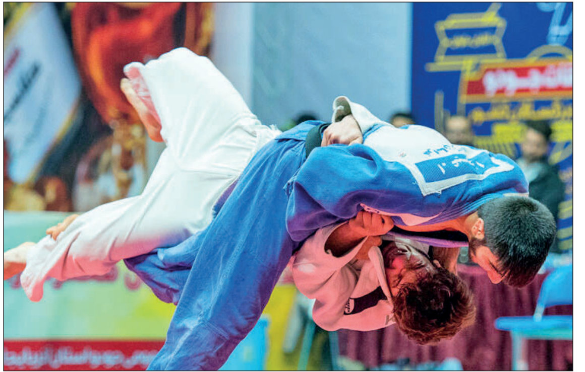
مسابقات جودو قهرمانی کشور