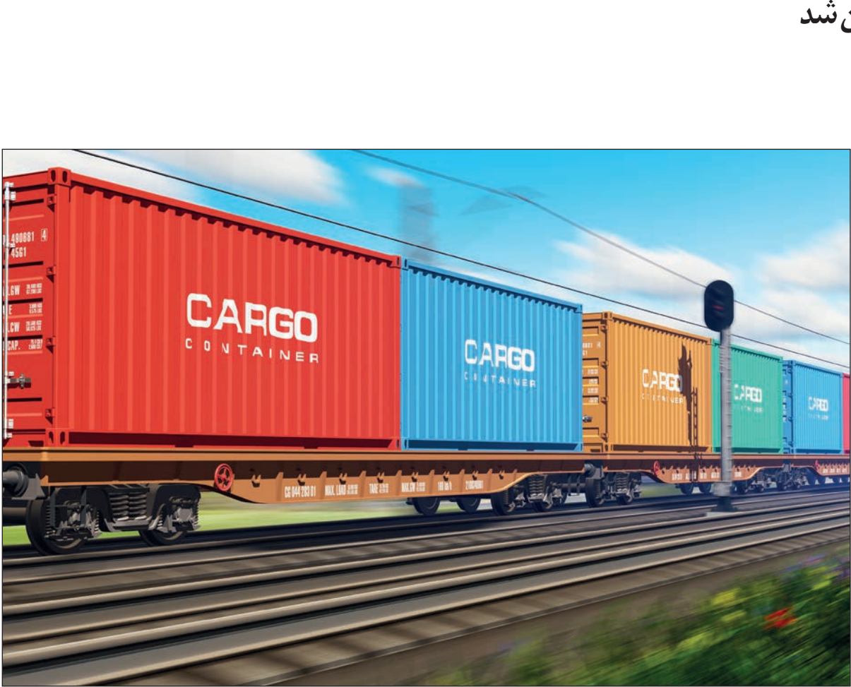
یک قطار حمل و نقل کانتینر در مسیر تهران-مشهد