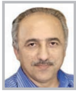
مر تفضی افقه

نخست (موضوع حذف ارز ۴۲۰۰ تومانی این روزها به یکی از مباحث مهم اقتصادی کشور بدل شده است و اقتصاددانان به ۲ گروه موافقان و مخالفان حذف دلار ۴۲۰۰ تومانی بدل شده و هر کدام به استدلال چرایی دیدگاه‌های خود می پردازند.