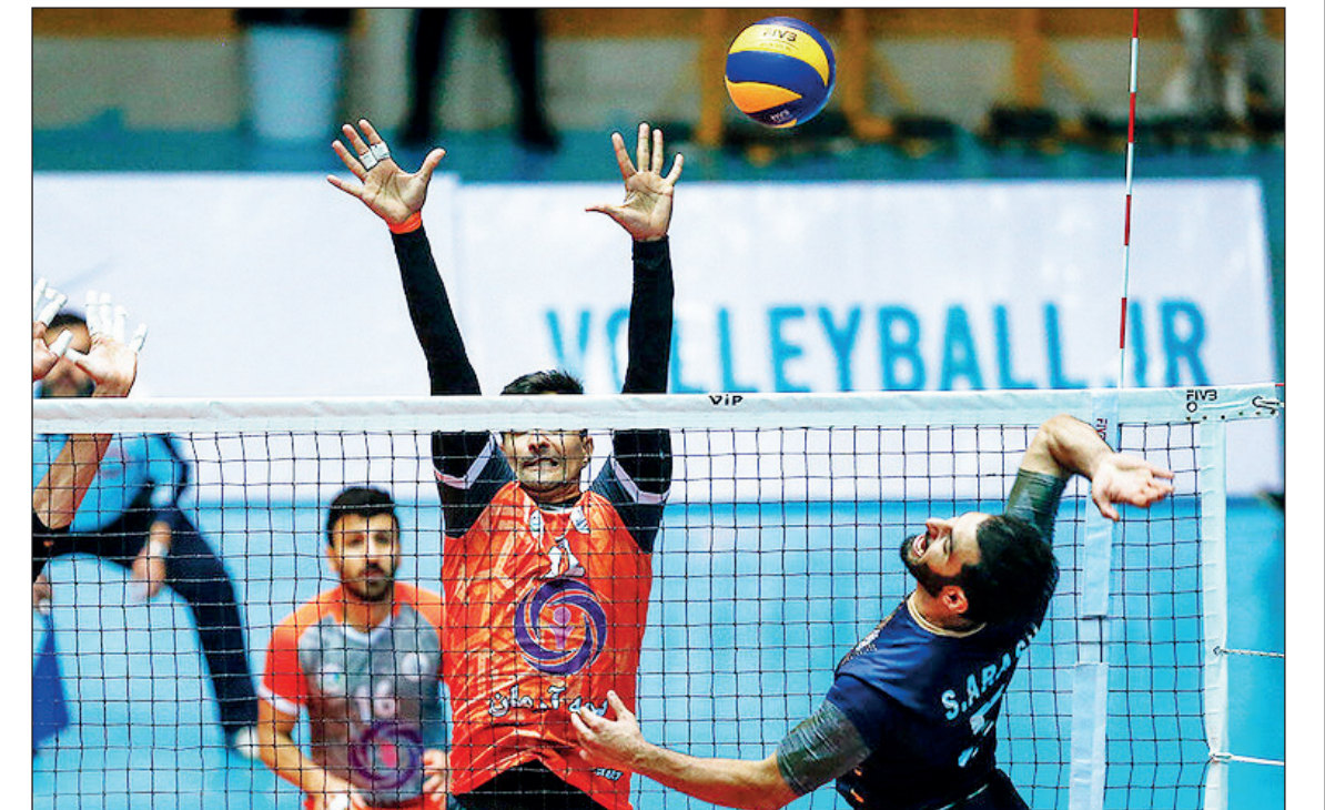
دیدار تیم‌های والیبال سایپا تهران و شهر داری ورامین