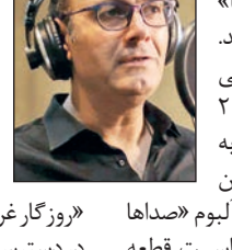
علیرضا قربانی خواننده موسیقی ایرانی برنده جایزه آکادمیا ۲۰۱۹ برای خوانندگی در قطعه «رویا» به آهنگسازی احسان مطوری شد. علیرضا قربانی خواننده موسیقی ایرانی برنده جایزه آکادمیا ۲۰۱۹ برای خوانندگی در قطعه «رویا» به آهنگسازی احسان مطوری شد. این قطعه با نام لاتین «ال سونیو» از آلبوم «صداهای با با» برنده جایزه آکادمیا شده است. قطعه «رویا» از بین ۱۵۰۰ قطعه در همین سبک و در تمام بخش‌های مدنظر از جمله آهنگسازی، تنظیم و آواز به عنوان بهترین اثر بخش موسیقی جهانی شناخته شد. قطعه «رویا» پیش‌تر نیز در «Global Music Awards» موفق به کسب عنوان شده است. علیرضا قربانی خواننده موسیقی ایرانی که طی ماه‌های گذشته درگیر اجرای پروژه «با من بخوان» با هنرمندی حسام ناصری و تعدادی دیگر از هنرمندان کشورمان بود به منظور برگزاری چند کنسرت به شهرستانای سفر می‌کند. بر اساس برنامه‌ریزی‌های انجام گرفته تا: تازترین کنسرت این خواننده ساعت ۲۰:۳۰ روز جمعه ۱۱ بهمن ماه در مجتمع فرهنگی ستارگان اراک برگزار می‌شود. علیرضا قربانی از دیبشت

عالمی‌نگاری به معنای تبادل بین‌المللی اطلاعات و تبادل بین‌المللی آگاهی و آشنایی بین کشورهای مختلف است. در گذشته، تبادل بین‌المللی آگاهی و آشنایی بین کشورهای مختلف، عمدتاً از طریق تجارت و سفرهای تجاری انجام می‌گرفت. با ظهور صنعت هواپیمایی و ارتباطات بین‌المللی، تبادل بین‌المللی آگاهی و آشنایی بین کشورهای مختلف، به سرعت گسترش یافته است. امروزه، تبادل بین‌المللی آگاهی و آشنایی بین کشورهای مختلف، از طریق اینترنت و شبکه‌های اجتماعی، به سرعت گسترش یافته است. این امر به کشورهای مختلف، امکان می‌دهد تا با کشورهای دیگر، به سرعت تبادل آگاهی و آشنایی داشته باشند. همچنین، این امر به کشورهای مختلف، امکان می‌دهد تا با کشورهای دیگر، به سرعت تبادل اطلاعات داشته باشند. این امر به کشورهای مختلف، امکان می‌دهد تا با کشورهای دیگر، به سرعت تبادل اطلاعات داشته باشند. این امر به کشورهای مختلف، امکان می‌دهد تا با کشورهای دیگر، به سرعت تبادل اطلاعات داشته باشند.