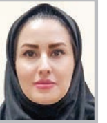
هلا غصمت پناه