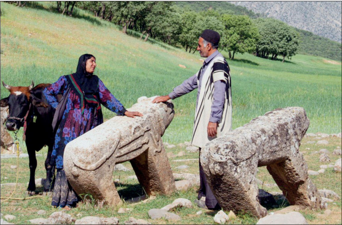
برد شیر (شیر سنگی) نماد باشکوه ایل بختیاری