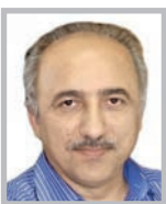
مر ترضی افقه