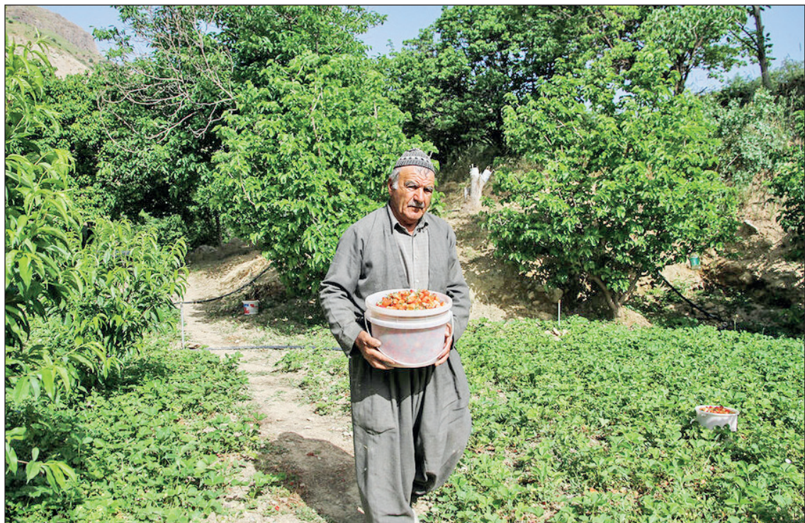
برداشت توت فرنگی از مزارع کردستان