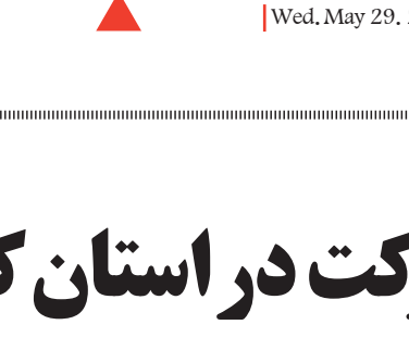
تصویر: بهار/تولید محتوا: بهار

اجتماع‌محور بنیاد برکت در مناطق محروم استان کهگیلویه و بویر احمد فعالیت خواهند کرد.