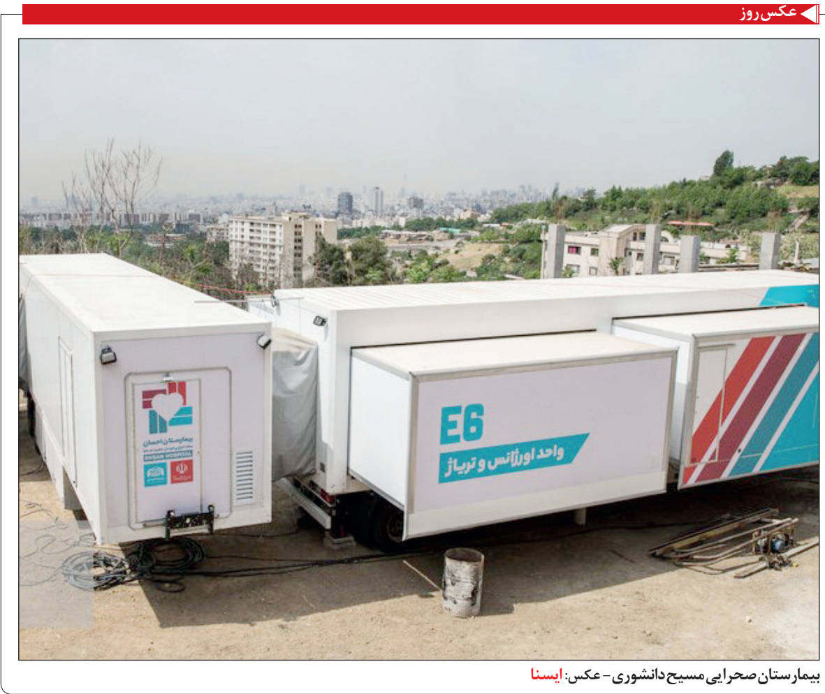
بیمارستان صحرایی مسیح دانشوری

خبر روز ۴۳۴ فوتی جدید کرونا در کشور بنابر اعلام وزارت بهداشت ۴۳۴ بیمار کووید ۱۹ در کشور جان خود را از دست دادند. با اعلام مرکز روابط عمومی و اطلاع رسانی وزارت بهداشت تاکنون ۷۴۴ هزار و ۹۱۴ نفر دُز اول واکسن کرونا و ۱۹۳ هزار و ۸۴۰ نفر دُز دوم را تزریق کرده‌اند و مجموع واکسن‌های تزریق شده در کشور به ۹۳۸ هزار و ۷۵۴ دُز رسید. و بر اساس معیارهای قطعی تشخیصی، ۲۱ هزار و ۷۱۳ بیمار جدید مبتلا به کووید ۱۹ در کشور شناسایی شد که سه هزار و ۴۶۷ نفر از آنها بستری شدند. مجموع بیماران کووید ۱۹ در کشور به دو میلیون و ۴۵۹ هزار و ۹۰۶ نفر رسید. تاکنون ۱۵ میلیون و ۵۶۲ هزار و ۵۶۰ آزمایش تشخیص کووید ۱۹ در کشور انجام شده است.