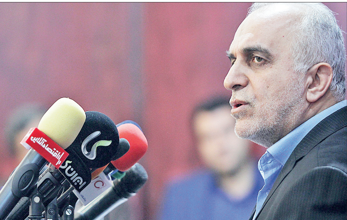
وزیر اقتصاد به پرسش‌های مطرح در مورد دلایل واگذاری‌ها پاسخ داد

تورم در میان دهک‌های مختلف هزینه‌ای، فاصله توری میان دهک‌ها در سال گذشته به ۲٫۷ درصد رسید که نسبت به سال قبل (۰٫۲ درصد) ۰٫۲ واحد درصد کاهش نشان