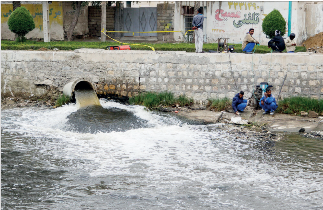
رها سازی فاضلاب بندر عباس به دریا