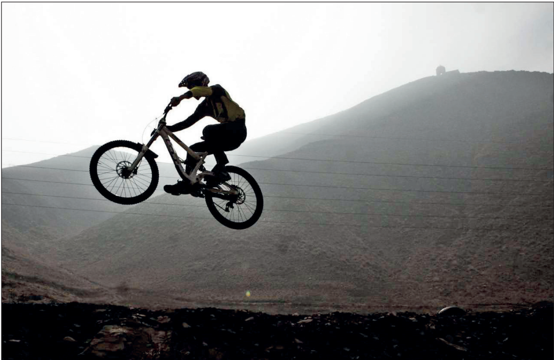
مسابقات لیگ دوچرخه سواری مردان کشور در اراک