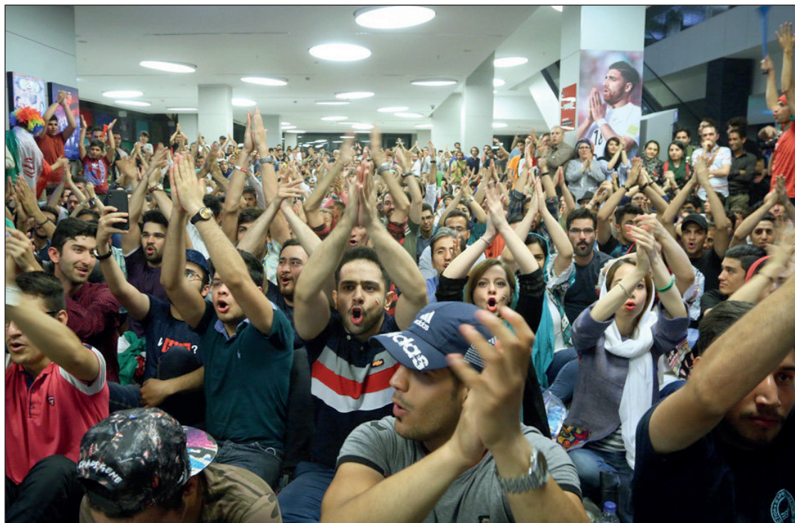
تماشای فوتبال ایران و پرتغال در پردیس سینمایی چارسو، تهران