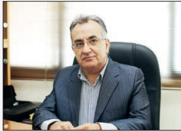
توسط پزشکان بررسی شده تا در شرایط کنونی کشور ضمن جلوگیری از شیوع ویروس کرونا بیمار و خانواده مضاعفی در مسیر درمان ایجاد کرده است. موسسه