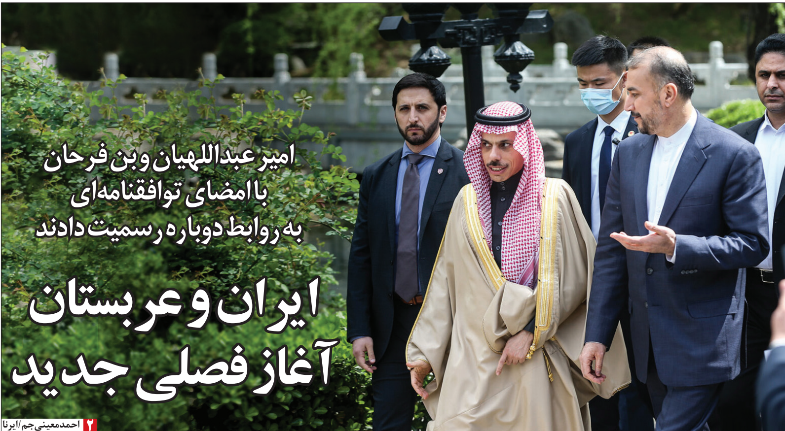
۲ احمد معینی جم/ایران

امیر عبداللهیان و بن فرحان با امضای توافقنامه‌ای به روابط دوباره رسمیت دادند