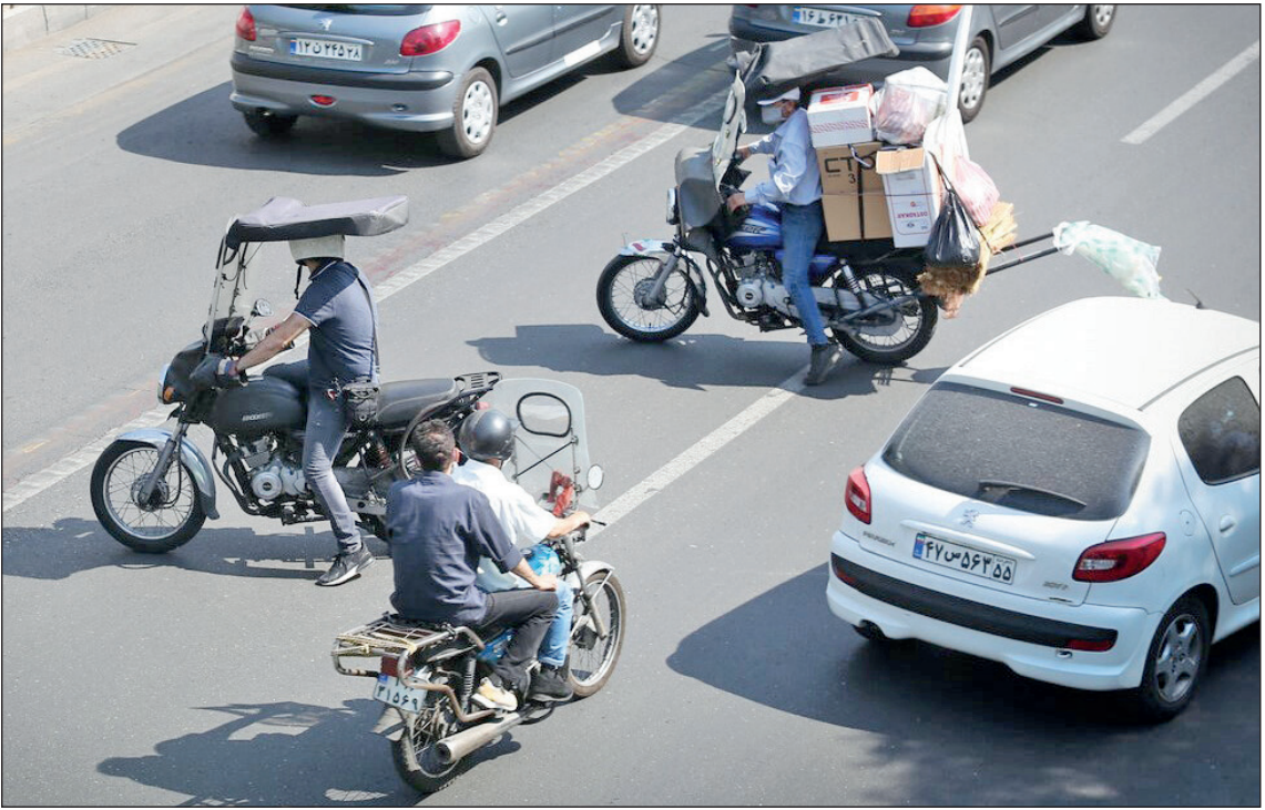
قانون شکنی موتور سواران در شهر