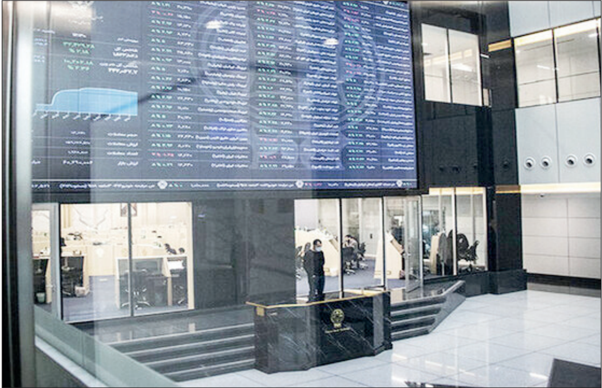
نمای داخلی از ساختمان بورس تهران در روزهای نخست فروردین ۱۴۰۱

سهام کردند. ارزش کل معاملات خرد هفت هزار و ۳۵۰میلیارد تومان بود، اشخاص حدود ۱۸ درصد