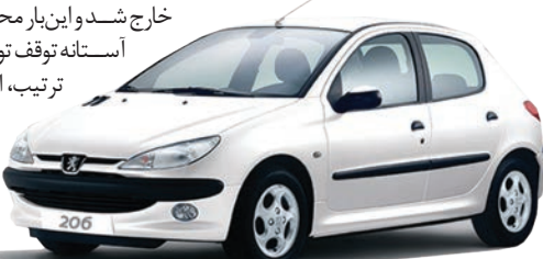
یادداشت ۳- ممثل صادر کنندگان سوخت طلایی