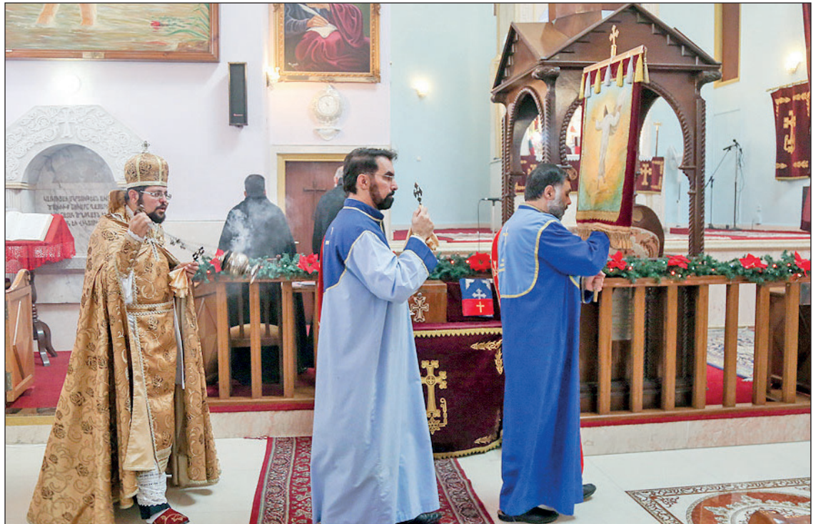
مراسم سال ۲۰۱۹ میلادی در کلیسای تارگمانچانس مقدس

صاحب امتیاز: موسسه رسانه نگاران خوب اندیش مدیرمسئول: الیاس حسرتی سر دبیر: منصور بیطرف نشانی: خیابان ستارخان - خیابان کوثر دوم - نبست میتو تلفن: ۶۶۴۲۰۷۶۹ - ۶۶۴۲۰۴۱۷ چاپ: روز تاب - توزیع: نشر گستر امروز - تلفن: ۶۱۹۲۳۰۰۰ سازمان شهرستان ها: ۶۶۱۲۶۰۸۸ ادان ظفر: ۱۳۰۰۸ | اذان مغرب: ۱۷:۲۲ | اذان صبح فردا: ۵:۴۴ info@taadolnewspaper.ir مرامنامه اخلاقی روز نامه تعادل در وبسایت رسمی روز نامه در دسترس است