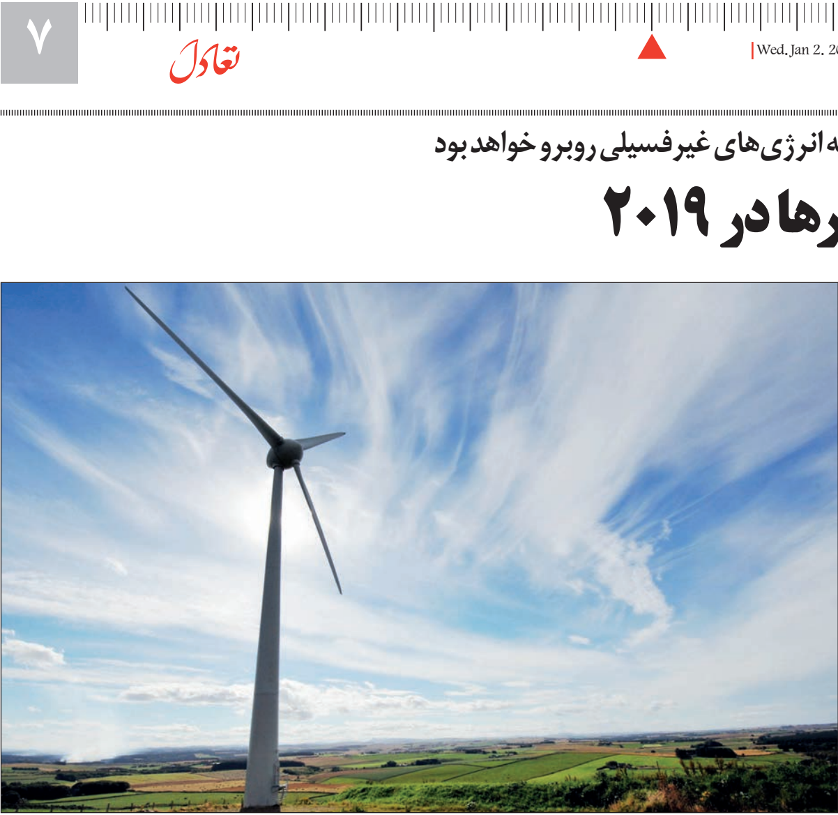
یک توربین بزرگ

در شبکه، دشوار رقم می‌خورد تجدیدپذیرها اکنون در حال تقویت انعطاف‌پذیری و قابلیت اطمینان شبکه هستند.