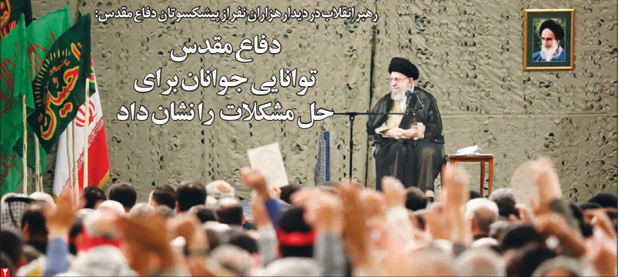
رهبر انقلاب در دیدار هزاران نفر از پیشکسوتان دفاع مقدس؛