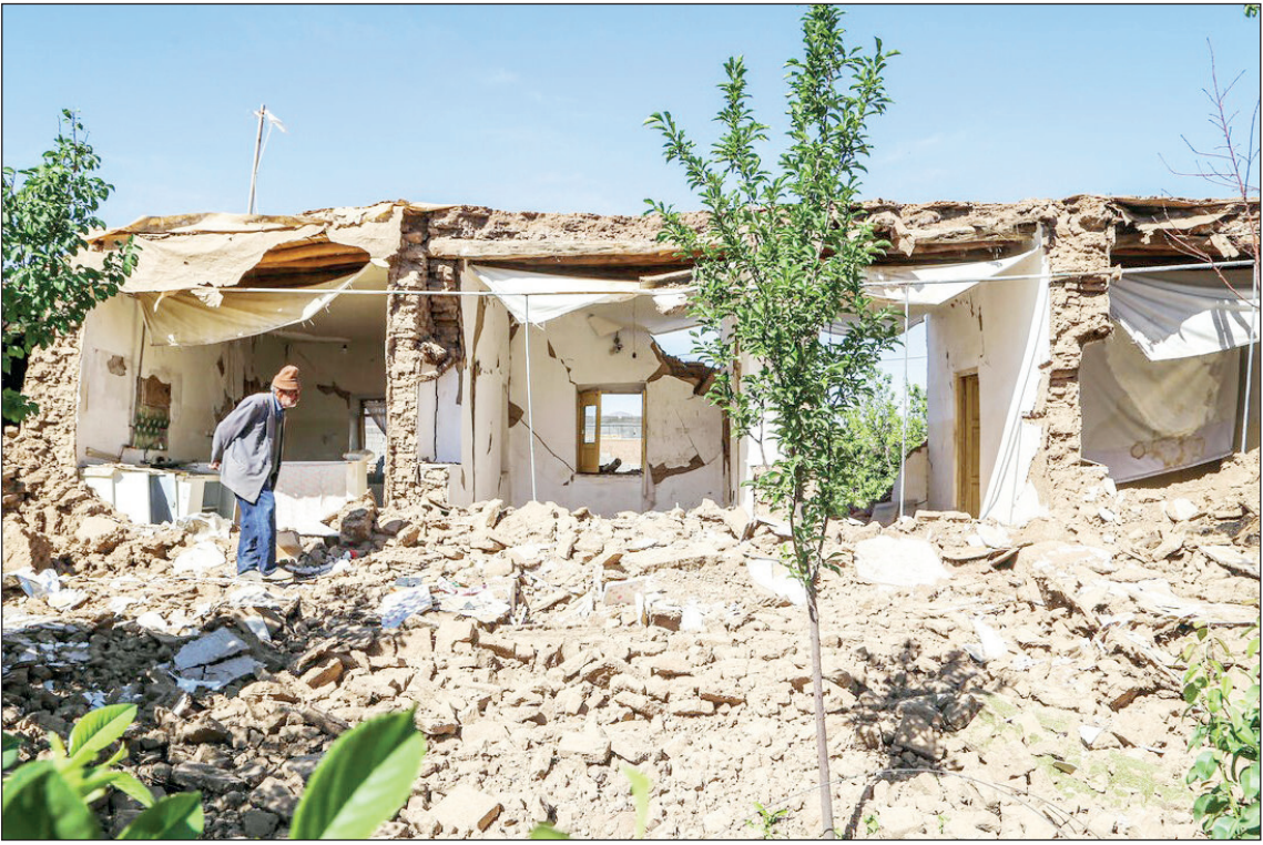
زلزله در روستای شورک از توابع خراسان شمالی