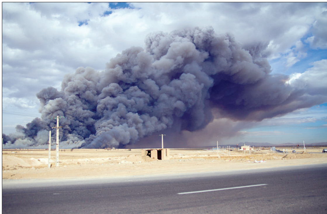
آتش سوزی تالاب میقان در اراک

info@taadolnewspaper.ir مرامنامه اخلاقی روزنامه تعادل در وبسایت رسمی روزنامه در دسترس است