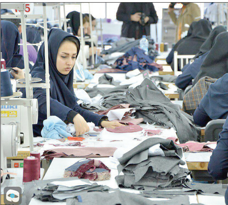
کشور مطرح باشد.

گزارش مرکز پژوهش‌های مجلس حاکی از آن است که نرخ مشارکت مردان و زنان در سال ۱۳۸۴ به ترتیب