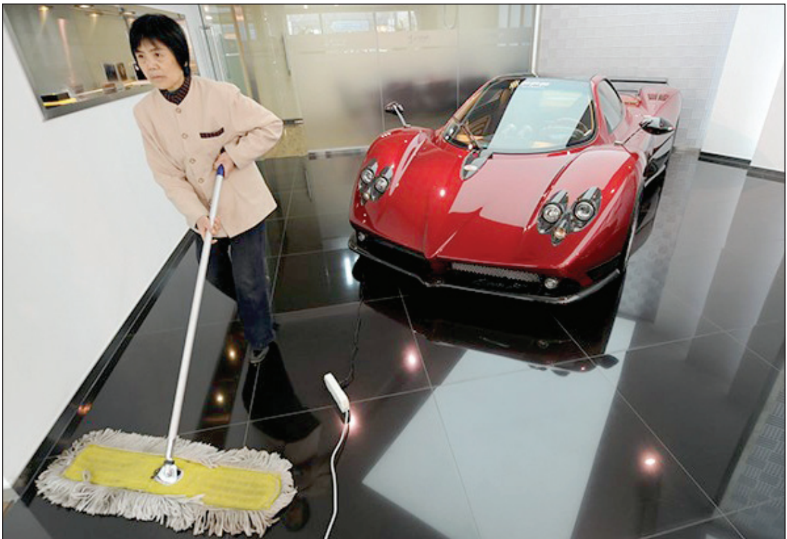
مولف: یوول نوا هراری | مترجم: علی کوچکی

گاردین - نابرابری به قدمت عصر پارینه‌سنگی است. ۳۰ هزار سال قبل، گروه‌هایی از قبایل شکارچی در روسیه، بعضی از اعضای قبيله را در مقابله با شکوه، انباشته از هزاران مهره از جنس عاج، دست‌بندها، جواهرات و اشیای هنری به خاک می‌سپردند در حالی که سهم بقیه چاله‌ی ساده در دل خاک بود.