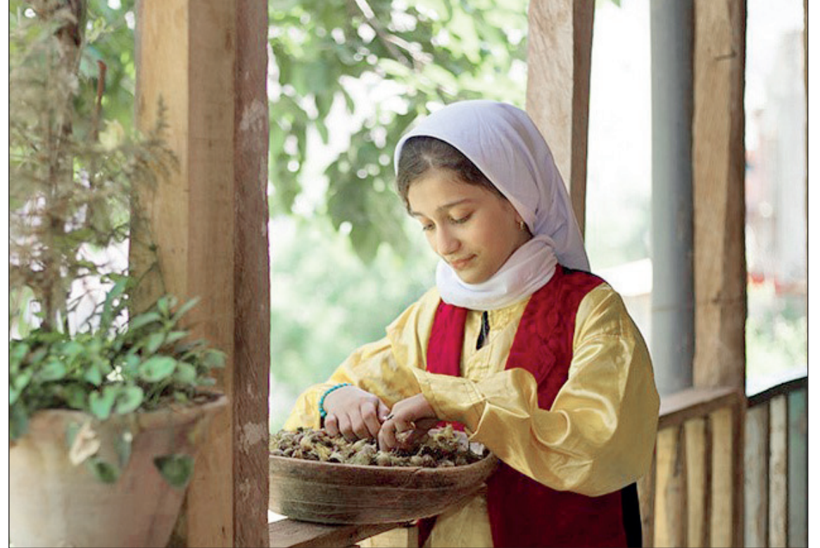
برداشت فندق در روستای فِشک واقع در بلندی های الموت