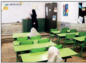
معاون برنامهریزی آموزشی و توانبخشی سازمان آموزش و پرورش استثنایی کشور: در سال گذشته و امسال در نظر گرفت تا شاخص های مناسب سازی در ساخت مدارس لحاظ شود.

معاون برنامهریزی آموزشی و توانبخشی سازمان آموزش و پرورش استثنایی کشور در نوزدهمین جلسه ستاد هماهنگی و پیگیری مناسب سازی مدارس کشور گفت: ۱۳ سالن ورزشی ویژه دانش آموزان با نیازهای ویژه در کشور به ۴۴ سالن افزایش یافت و ایجاد ۱۴۱ سالن ۲۲۰ مترمربعی ورزشی با مشارکت سازمان نوسازی از دیگر اقدامات مناسب سازی آموزش و پرورش به شمار می رود.