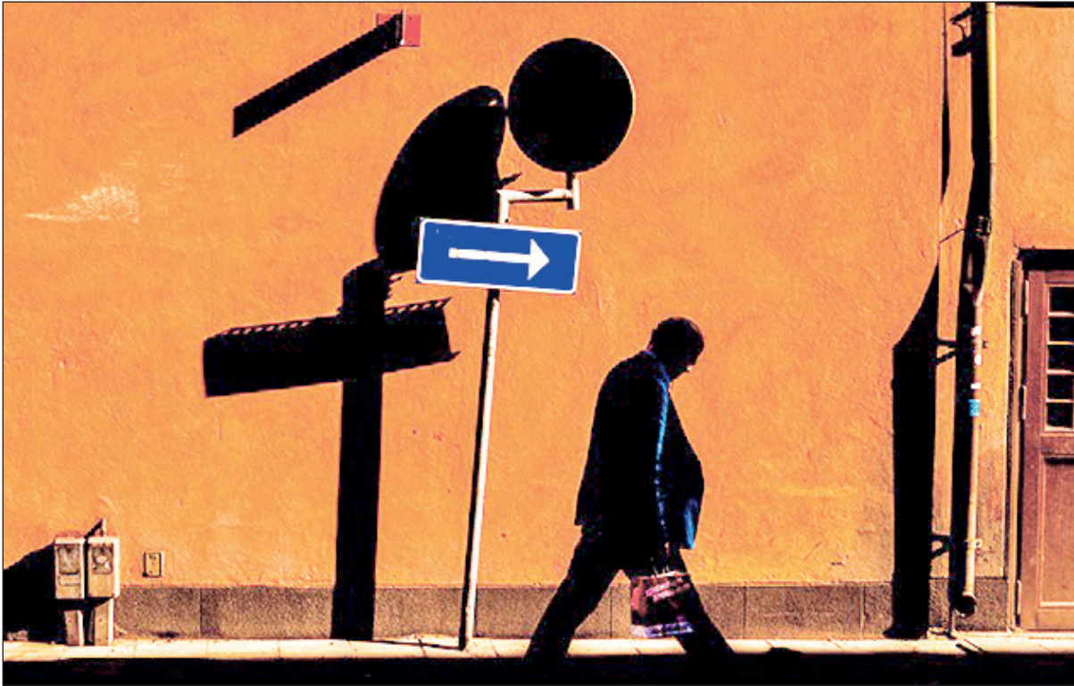
یک مرد در حال عبور از یک چراغ راهنما در خیابان نیویورک