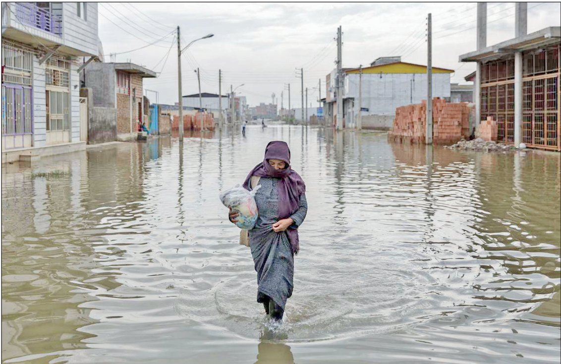
بحران در شهرهای سیل زده ادامه دارد / گلستان