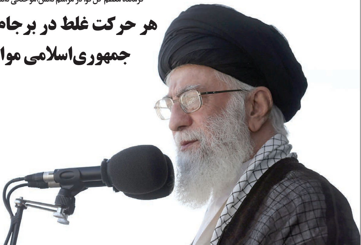
صفحه ۲

هر حرکت غلط در برجام با عکس‌العمل جمهوری اسلامی مواجه می‌شود