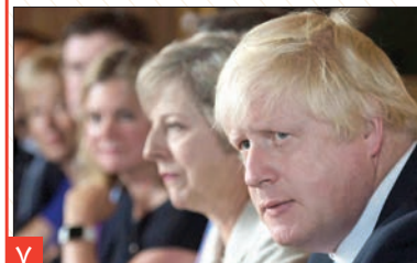
صفحه ۲