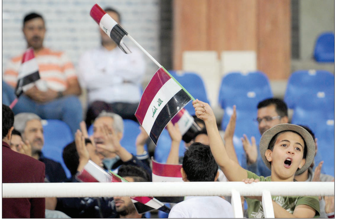
بازی افتتاحیه ورزشگاه امام رضا (ع) بین تیم‌های منتخب مشهد و کربلا