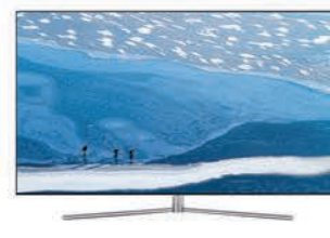
QLED TV Q77F I75"