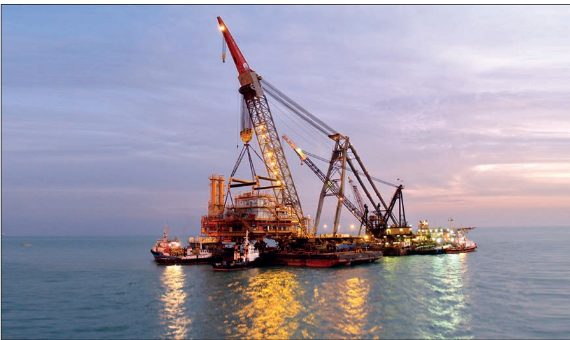
گروه اقتصاد کلان

مرکز پژوهش‌های مجلس در ادامه سلسله گزارش‌های خود با موضوع بررسی لایحه بودجه ۹۷ در گزارشی مجزا به بررسی وضعیت شرکت‌های دولتی پرداخته و پیشنهادهایی را هم برای بازنگری در لایحه بودجه ارائه داده است. براساس تصویری که این مرکز از شرکت‌های دولتی ترسیم کرده است، در لایحه بودجه ۹۷ به تعداد ۳۷۷ شرکت دولتی وجود دارد که تنها سه شرکت نسبت به سال ۹۶ کاهش یافته است. نمای کلی شرکت‌های دولتی حاکی از آن است که ۷۹ شرکت دولتی حوزه نفت و گاز حدود ۶۴ درصد از منابع و مصارف بودجه را به خود اختصاص داده‌اند. همچنین ۷۹ درصد از مالیات شرکت‌های دولتی از طریق شرکت‌های حوزه نفت و گاز تأمین می‌شود. سهم غالب شرکت‌های نفتی در درآمدهای مالیاتی بودجه در حالی است که بانک و بیمه سهم ۱۲ درصدی و شرکت‌های حوزه برق سهم ۲ درصدی دارند.