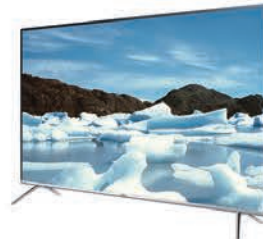
PUHD TV MU8990 I82"