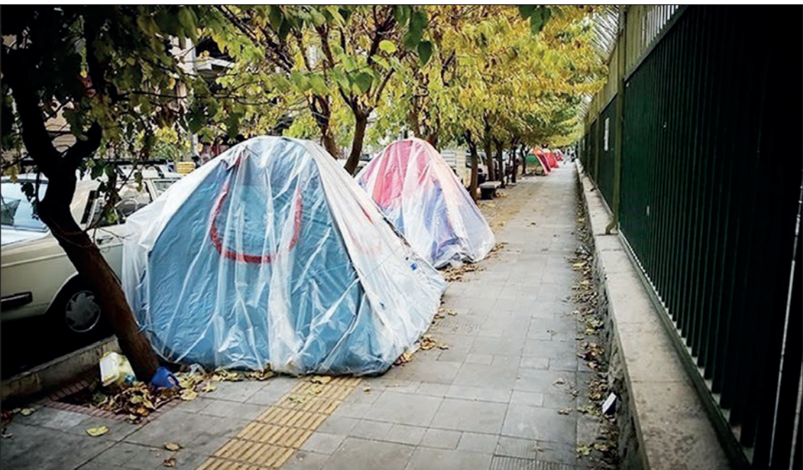
گروه اقتصاد اجتماعی

ردید چادرهای مسافرتی که در پیاده رو کنار برخی بیمارستان‌های پایتخت دیده می‌شود، نه ربطی به زلزله دارد و نه هیچ حادثه دیگر، بلکه این تصویر قدیمی از حضور همراهان بیمارانی است که در بیمارستان‌ها بستری هستند. چادرهای رنگ و رو رفته‌یی که زمستان و تابستان نمی‌شناسند و در سرمای زمستان و گرمای تابستان، سقف بالای سر همراهان می‌شوند. تمرکز مراکز درمانی و پزشکان متخصص در تهران سبب می‌شود، همراهان رنج چنین اقامتی را به جان بخرند تا بیمارانشان در بیمارستان‌های بهتر و تحت نظر متخصصان درمان شوند اما اغلب این مراجعه‌کنندگان که از اقسار کم درآمد و ضعیف هستند و در طول درمان بیمارشان توانایی اقامت در هتل‌ها یا حتی مسافرخانه را هم ندارند، اقامتی که معلوم نیست یک شب باشد یا چندین ماه، به همین دلیل است که همراهان پشت دیوار بیمارستان یا در خیابان‌ها و پارک‌های اطراف آن آواره‌اند و علاوه بر غم بیماری باید غم غربت را هم به جان بخرند.