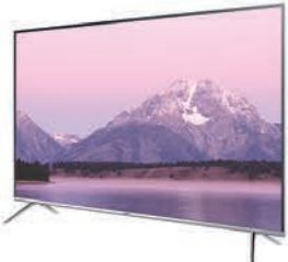
PUHD TV MU8990I75"