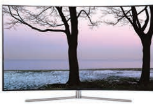
QLED TV Q78C I65"