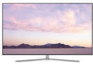
QLED TV Q77F I65"