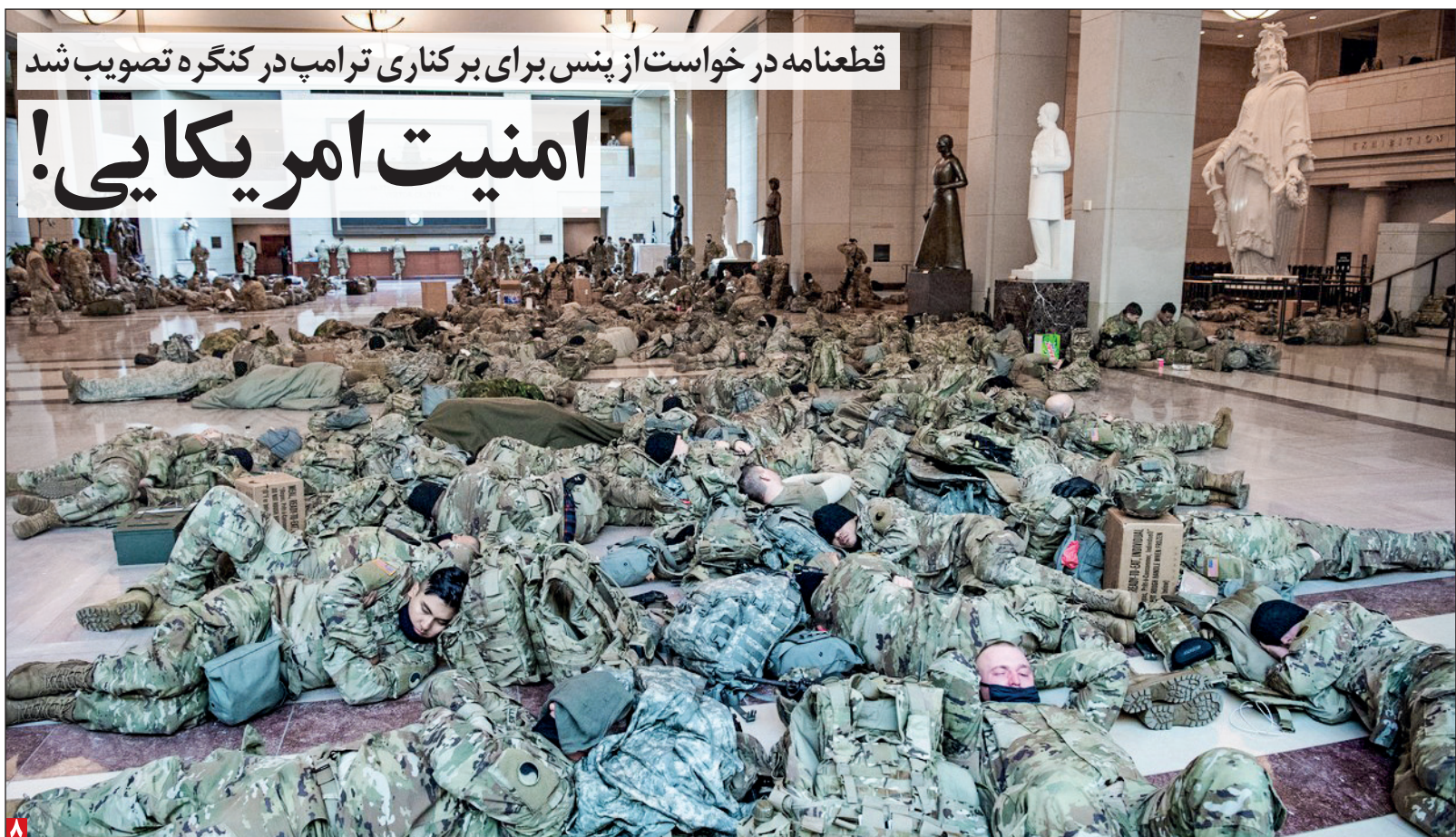
قطعنامه در خواست از پنس برای برکناری ترامپ در کنگره تصویب شد