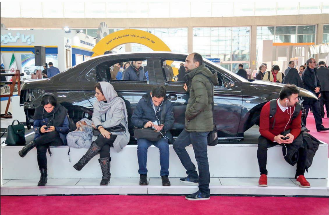
افتتاحیه سومین نمایشگاه بین المللی خودرو تهران