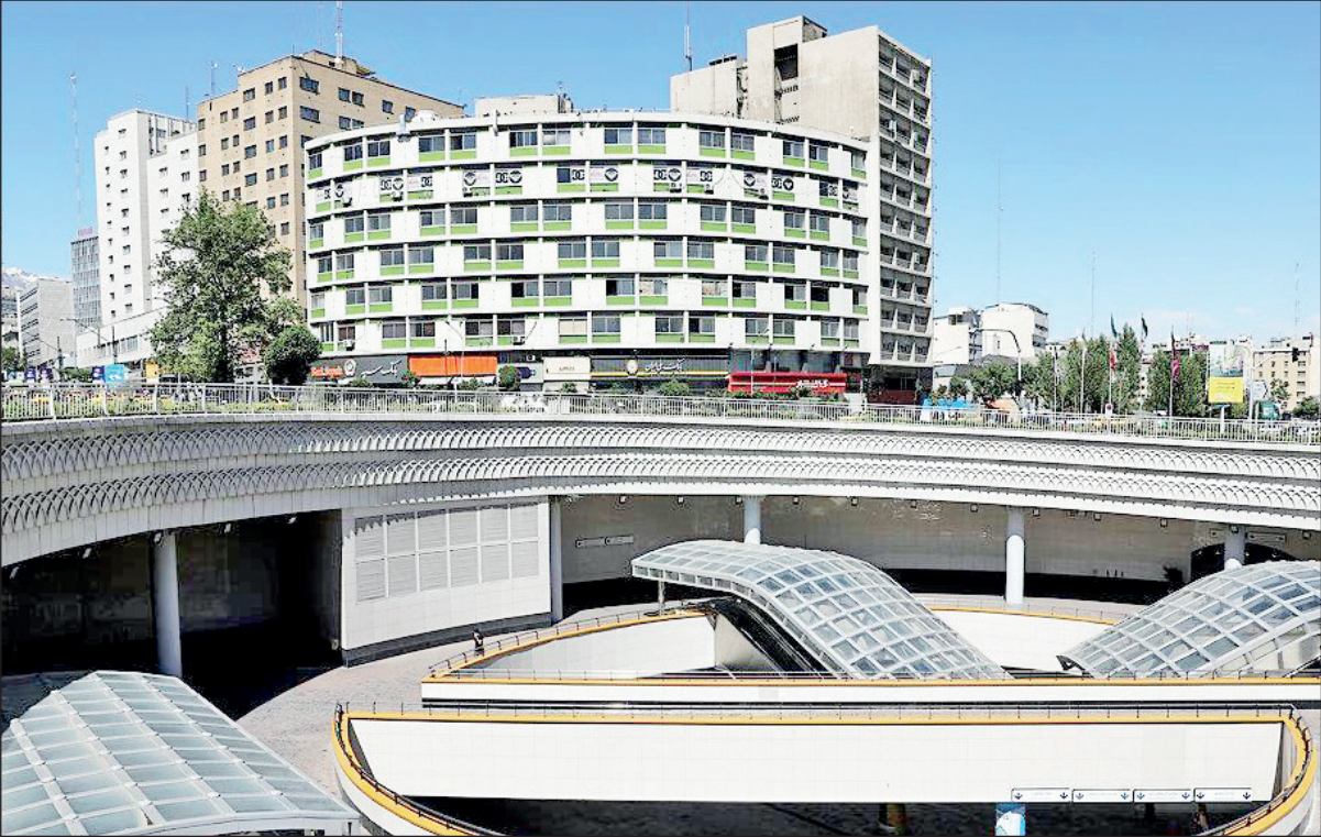
محسن هاشمی: مدیریت پیامدهای زلزله قطعاً از توان شهرداری تهران خارج است