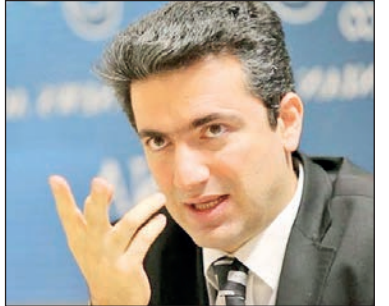
یادداشت - ۱

باز کردن غل و زنجیر تصمیمات دولتی از اقتصاد