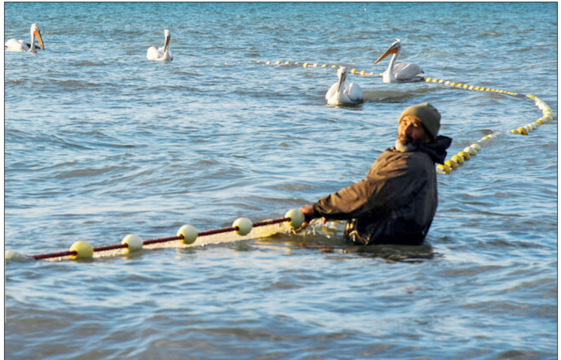
صید ماهی در شب جزیره «میانکاله»