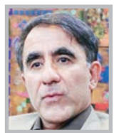
بیت الله ستاریان