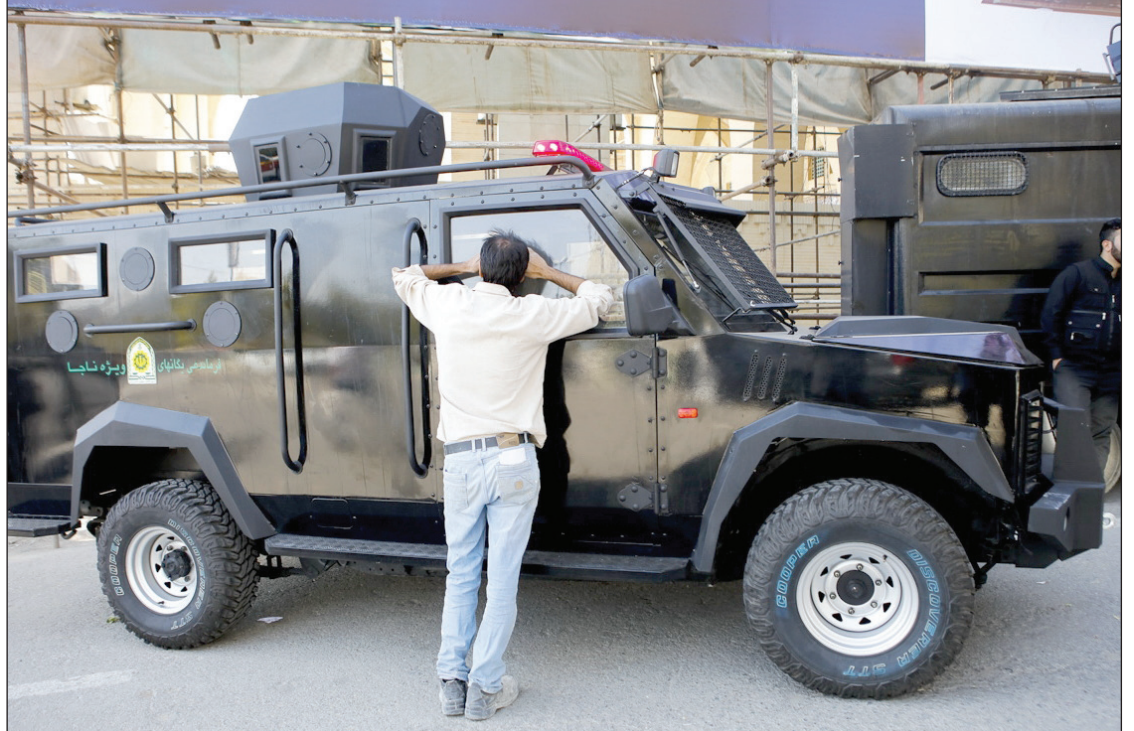
شانزدهمین نمایشگاه بین‌المللی لوازم و تجهیزات پلیسی، امنیتی و ایمنی (ایپاس)