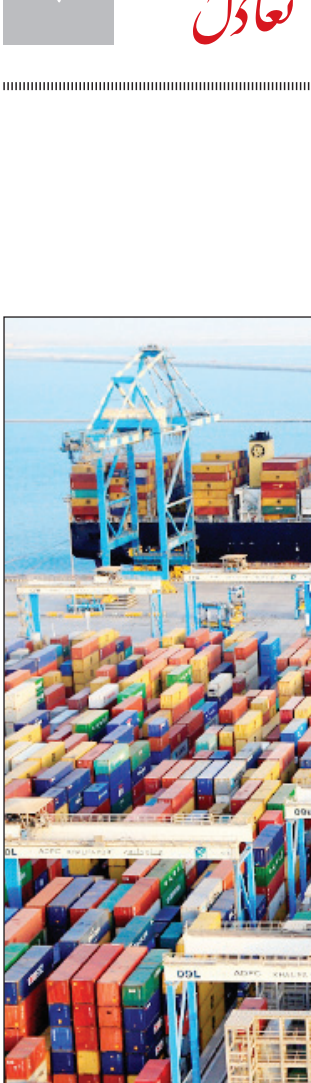
صادرات کامیون از ایران به آفریقا

منابعی پیش‌بینی شد تا از بر ساخت‌های این مناطق توسعه یابد و از محرومیت این مناطق