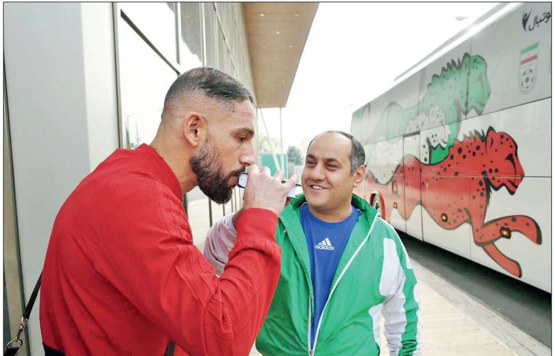
بدرقه تیم ملی فوتبال ایران به اردوی قطر قبل از جام ملت‌های آسیا

صاحب امتیاز: موسسه رسانه نگاران خوب اندیش مدیرمسئول: الیاس حسرتی سرمدبیر: منصور بیطرف نشانی: خیابان ستارخان - خیابان کوثر دوم - بن‌بست میتو تلفن: ۶۶۴۲۰۷۶۹ - نمابر: ۶۶۴۲۰۴۱۷ چاپ: روز تاپ - توزیع: نشر گستر امروز - تلفن: ۶۱۹۳۳۰۰۰ سازمان شهرستان‌ها: ۶۶۱۲۶۰۸۸ اذان ظهر: ۱۲:۰۰ اذان مغرب: ۱۷:۱۲ اذان صبح فردا: ۵:۳۹ info@taadolnewspaper.ir مرامنامه اخلاقی روزنامه تعادل در وبسایت رسمی روزنامه در دسترس است