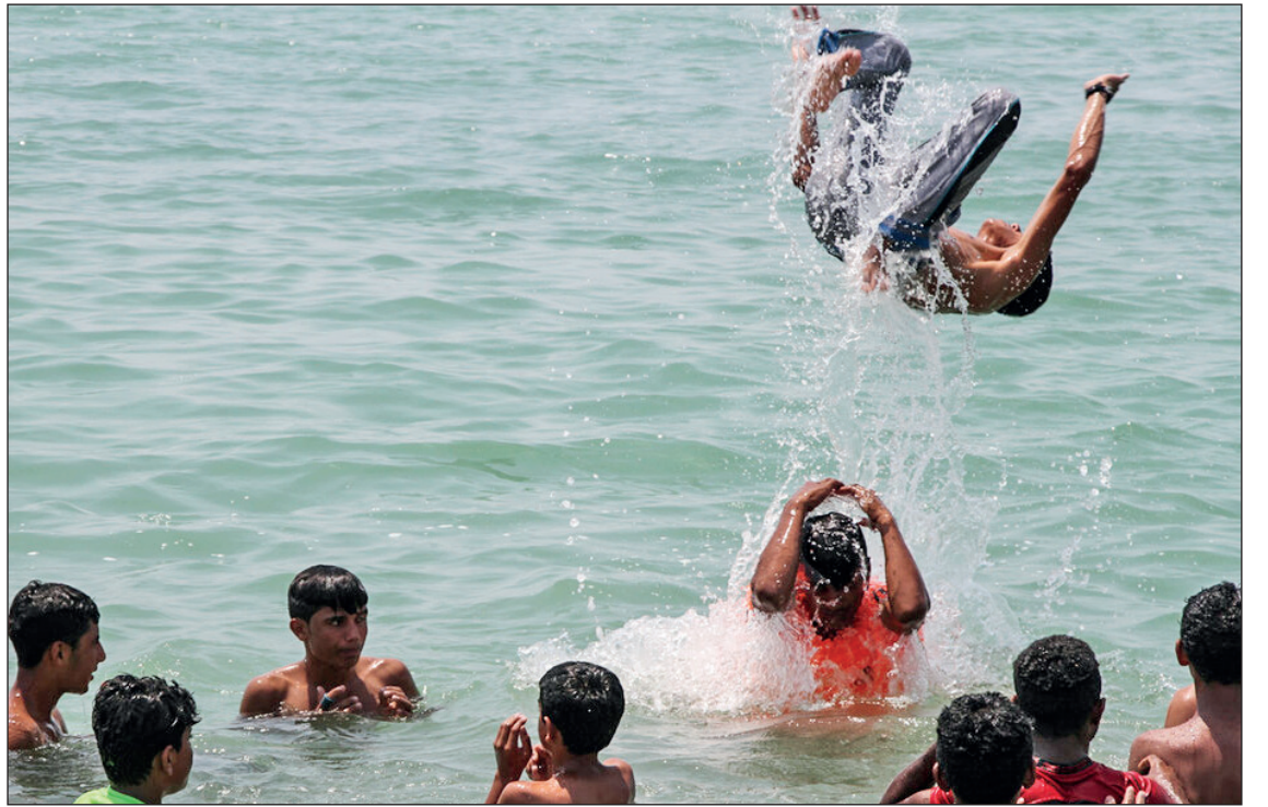
آب تینی در گرمای بندر عباس