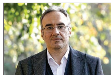
مطبوعات و رسانه‌ها است؟

متأسفانه در ردیف حمایت از نشر و مطبوعات در سال ۱۴۰۰ اعتبار خوبی پیش‌بینی نشده و این موضوع تهدیدی برای پایداری رسانه‌ها در شرایط ناشی از رکود تورمی و همه‌گیری ویروس کروناست. سرانه بودجه فرهنگ ۱۴۰ هزار تومان یعنی روزانه ۱۰۰ تومان برای هر نفر است. مسلمانان هم کسری کوچکی از این مبلغ خواهد شد و اگر دقیق بررسی شود، خواهیم دید که کل بودجه مطبوعات و سایت‌ها به مراتب از هزینه هدررفت بنزین در ترافیک روزانه تهران هم کمتر است. در واقع سهم حوزه فرهنگ نسبت به کل بودجه