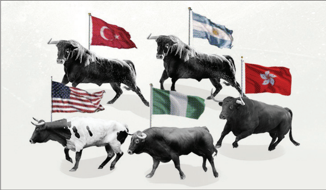
اگر شما به جایی که ما امروز ایستاده‌ایم نگاه کنید می‌بینید که بازارهای نیجریه هنوز هم یکی از ارزان‌ترین بازارهای جهان است.